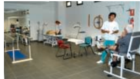
Disponen de este Servicio nuestros hospitales: Bellevue, Lanzarote, Sur, Roca y Cancún.