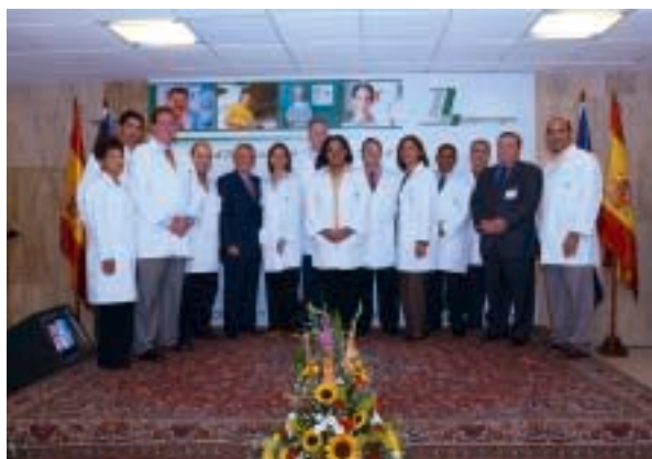
Parte del equipo médico Hospiten Santo Domingo.