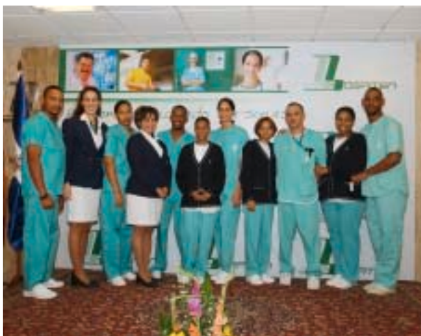
Parte del equipo de enfermería Hospiten Santo Domingo